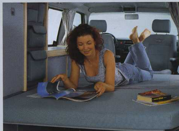
Foto oben: Sitzgruppe mit großem Tisch. Foto unten: Rücksitzbank wird zur geräumigen Liegefläche.

Über die umfangreiche Serienausstattung des California Coach hinaus verfügt der California Generation u. a. über Klimaanlage, Standheizung mit Zeitschaltuhr, beheizbare Vordersitze, Wärmeschutzverglasung im Fahrerhaus und Isolierverglasung im Wohnbereich, Nebelscheinwerfer und Teppicheinlegeböden im Fahrerhaus und Wohnbereich.