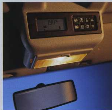
Im Blickfeld angeordnete Zentralelektronik mit Bedienung für Standheizung und Kühlbox.

des „Generation“ ein Fahrradträger, der gleich vier Fahrräder aufnehmen kann, egal ob Kinder-, Tourenräder, Mountainbike oder Trekkingrad.